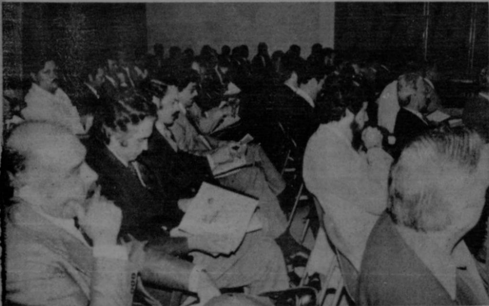
Las asistencias de asociados a las asambleas generales de la Cámara de Industrias es siempre numerosa, con el interés de todo el sector productivo en las decisiones y buena marcha de la institución.

Otra novedad es que la Dirección queda facultada para rechazar total o parcialmente gastos cuando los considere excesivos o no indispensables, pero cuando esto suceda se presume de derecho que quien haya recibido el pago efectivamente percibió la suma y deberá pagar los impuestos que corresponden.