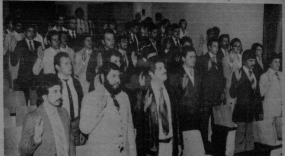
Momentos de la juramentación del grupo de ingenieros graduados por el Instituto Tecnológico de Costa Rica, ya incorporados al Colegio Federado de Ingenieros y Arquitectos.