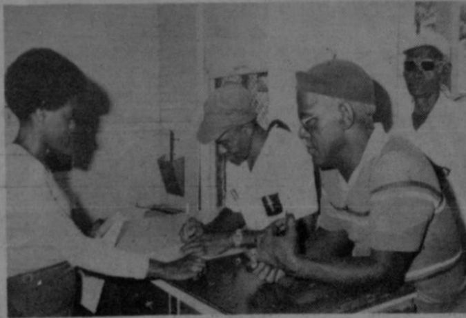
Personal de Cía. de Estiba, S.A. recibiendo cheques del fondo para la previsión de emergencias.

Con un fondo especial se asiste a trabajadores de bajos ingresos en los muelles de Puerto Limón