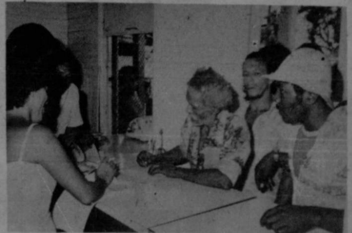
Momento en que trabajadores de Cía de Estiba, S.A. reciben dinero del fondo para la previsión de emergencias.

Estos subsidios no son reembolsables por parte de los empleados. De este modo Compañía de Estiba, S.A. ayuda a crear un clima de confianza y armonía entre sus trabajadores y la empresa.