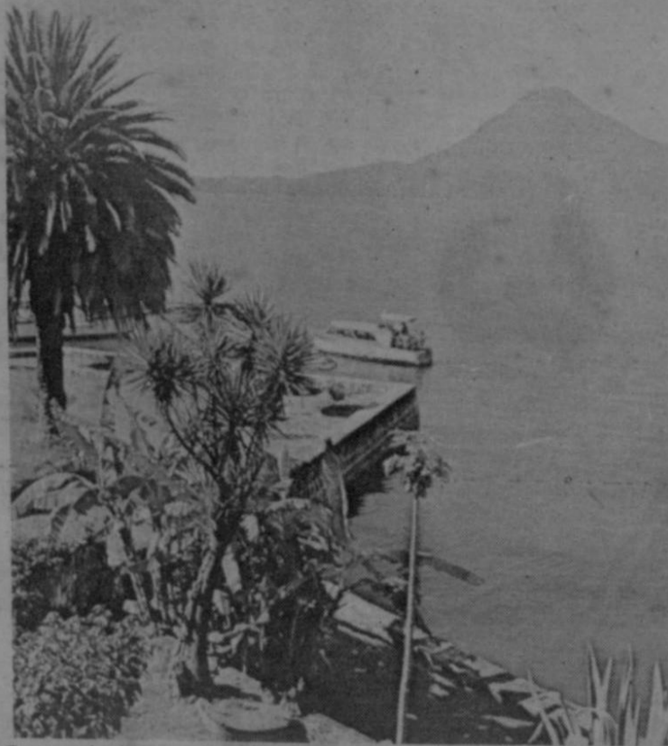
Guatemala espera a los expositores de Centroamérica para asistir a su feria, entre el 31 de octubre y el 9 de noviembre, próximos.

El objeto del impuesto y los contribuyentes, en esencia son los mismos que contemplan la Ley actual, con la excepción de las cooperativas y asociaciones solidaristas, que se gravan después de los diez años de su constitución. Las sociedades de profesionales y las individuales de responsabilidad limitada se excluyen porque las contempla el Impuesto sobre el Ingreso Personal.